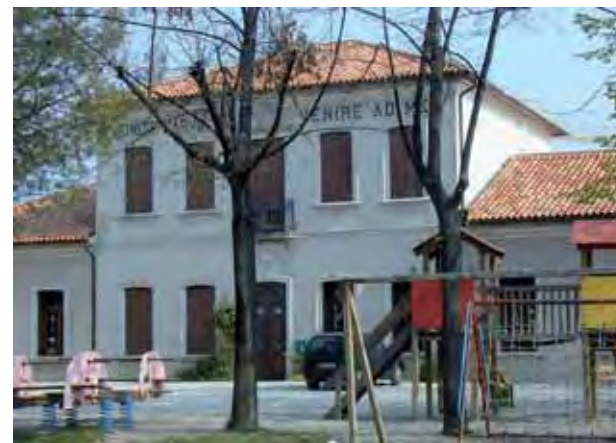
Lasilo Sinite Parvulos a Colle

«È in cantiere - prosegue il parroco - il progetto dell'Eucaristia di Maturità per i diciottenni. Desideriamo accompagnare, nei prossimi anni, i giovani