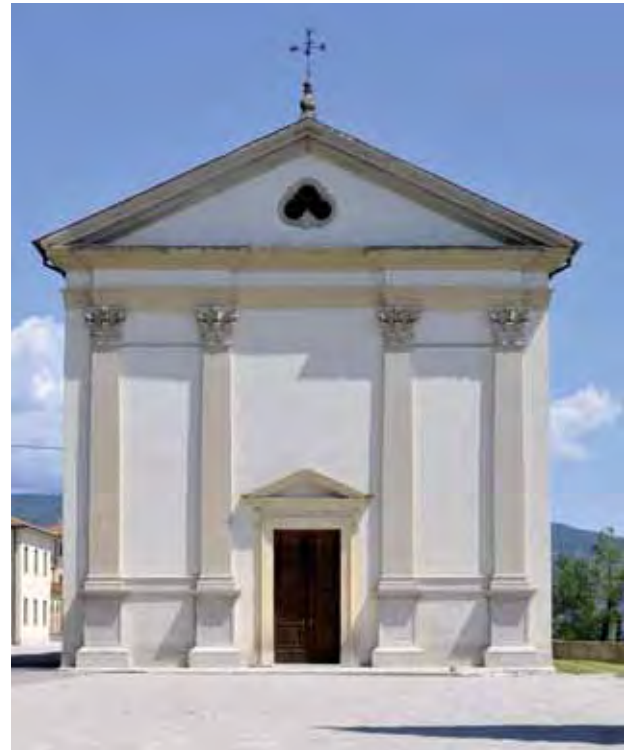
La chiesa di Colle Umberto