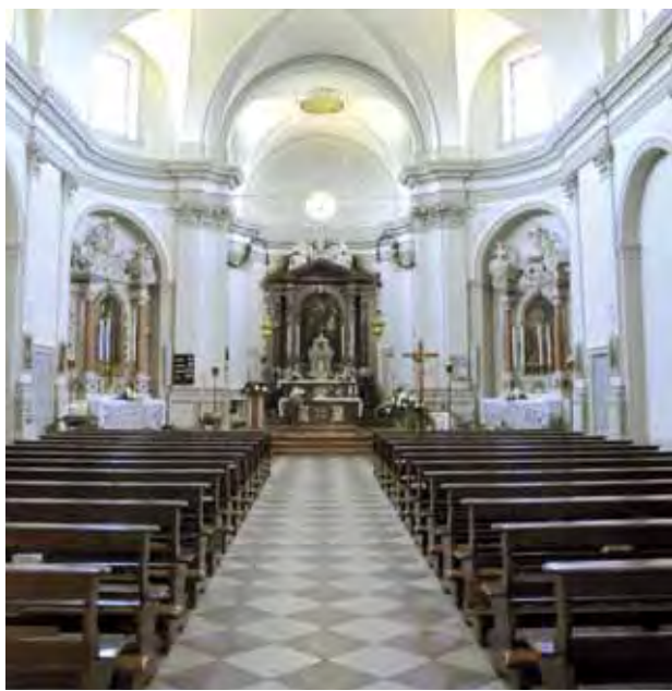
L'interno della chiesa di San Martino

gli archi del loggiato e frammenti di affreschi. Il campanile fu demolito nel 1852 in quanto pericolante e quello nuovo venne costruito su progetto dell'architetto Domenico Pellatis di Ceneda. Sull'altar maggiore si trova una tavola del pittore Gasparo Fiorentini realizzata il 29 aprile 1678 e sull'altare di destra una tela del pittore veneziano Giuseppe Moretti. L'organo è opera del 1855 di Giovanni Battista De Lorenzi, trasformato da Gaetano Zanfretta all'inizio del XX secolo e riportato alla sua condizione originale da Alfredo Piccinelli nel 1972. MS