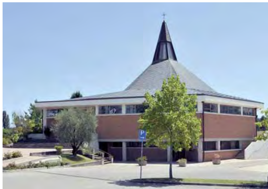
La chiesa di Menarè. A destra un'immagine dell'interno